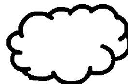
250 g di mascarpone